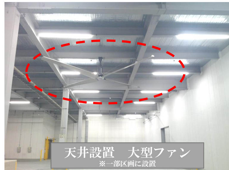
天井設置 大型ファン ※一部区画に設置