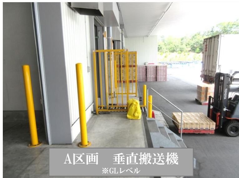
A区画 垂直搬送機 ※GLレベル